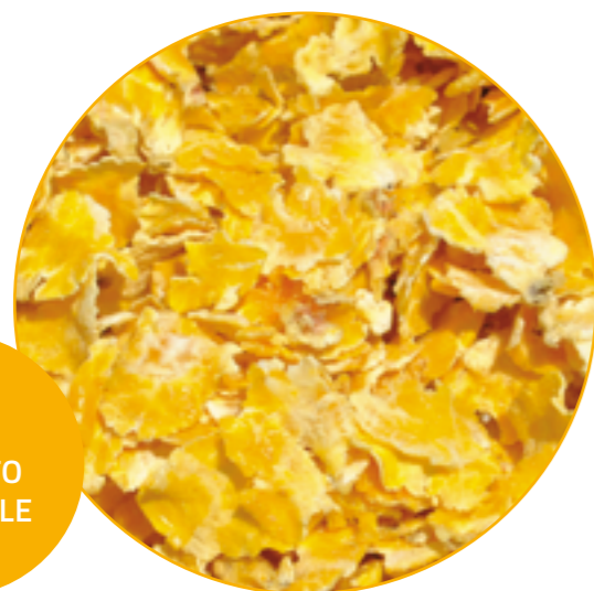
MAIS FIOCCATO INTEGRALE