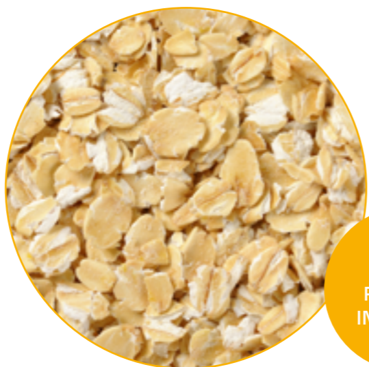
AVENA FIOCCATA INTEGRALE