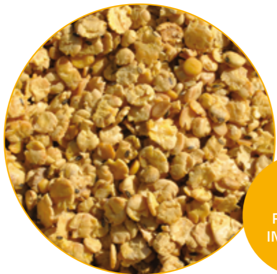
SOIA FIOCCATA INTEGRALE