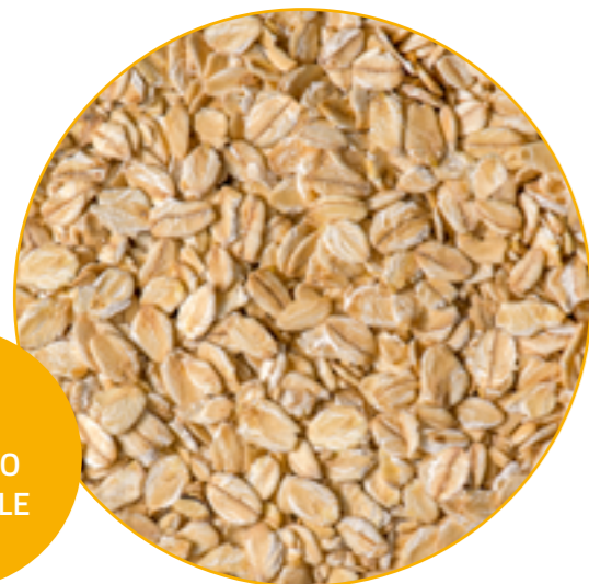
ORZO FIOCCATO INTEGRALE